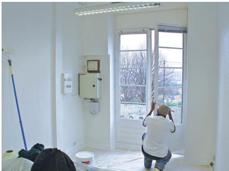
Une première expérience professionnelle pour 5 jeunes feyzinois de 16 et 17 ans.