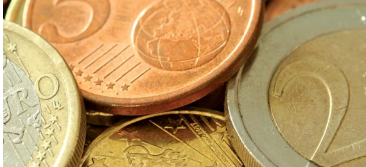
Baisse du taux de la taxe foncière et poursuite des investissements ont été annoncées lors du DOB.

Côté recettes, le Maire a notamment confirmé le projet de baisse du taux de la taxe sur le foncier bâti. L'objectif étant de ramener ce taux sous la barre des 20 %, conformément à l'engagement pris en début de mandat. Pour atteindre cet objectif sans nuire aux investissements en cours, les dépenses de fonctionnement de la Mairie resteront rigoureusement maîtrisées en 2012 et il n'y aura, pour la cin-