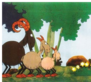
Dans Biques Piafs, les enfants découvrent de drôles d'animaux.

Globulus est une oeuvre poétique dédiée aux très jeunes enfants, à partir de 18 mois. Une création de la compagnie Ouragane qui réunit la danse, la vidéo, la musique et le théâtre d'objets et emmène les spectateurs dans un univers ludique. A découvrir le samedi 4 février, à 15h30. □