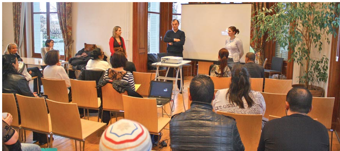
Une rencontre conviviale pour faire connaissance et officialiser le moment de la signature des baux.

A l'initiative du bailleur social HMF et de la ville de Feyzin, les futurs locataires de l'immeuble "Les rives du parc" étaient conviés en Mairie pour signer leur bail. Ils ont pris possession de leur logement en janvier.