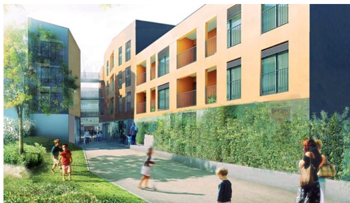
Projet d'immeuble de GLH rue du 11 novembre - Architecte Playtime

A la demande de la municipalité, le rez-de-chaussée de l'immeuble que va construire Grand Lyon Habitat, rue du 11 novembre, a été réservé pour accueillir une petite surface commerciale. Des contacts sont actuellement en cours avec différentes enseignes pour l'exploitation de cette nouvelle activité, dont les études ont prouvé la viabilité.