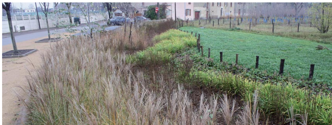
La forêt des Razes valorise des terrains inutilisables.

En parallèle du développement de l'habitat aux Razes, la ville oeuvre aussi à l'amélioration des services et du cadre de vie dans tout le quartier. Au coeur de la résidence du Vercors, les espaces extérieurs vont par exemple faire l'objet de travaux de requalification. Les résidents, qui ont participé activement à l'élaboration du projet grâce à un processus de concertation, pourront ainsi profiter d'une nouvelle aire de jeux et d'espaces verts réaménagés dès la fin des travaux, qui doivent démarrer au printemps 2012.