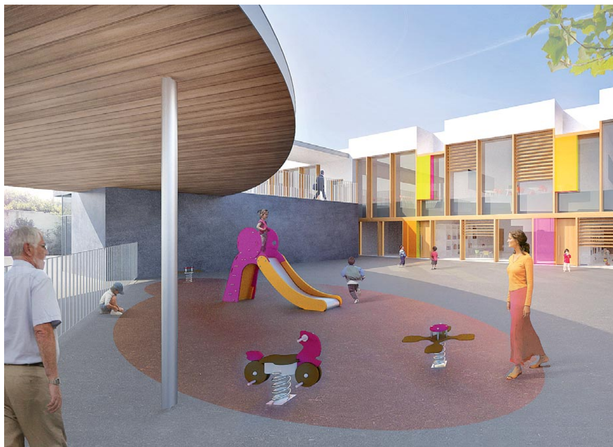
L'avenir des Razes, c'est une nouvelle école, mais aussi des logements et équipements supplémentaires, des aménagements du cadre de vie...

Pour le quartier des Razes, 2012 sera une année importante, point de départ de nombreux projets et aménagements, qui offriront, à terme, un nouveau visage au quartier. D'ici à la fin du mandat municipal en cours, une nouvelle école devrait être sortie de terre, de nouveaux logements et locaux commerciaux verront le jour et des aménagements de loisirs et d'amélioration du cadre de vie seront réalisés. Des abords de la place Béry et de la rue des Razes jusqu'à la rue Jean Bouin, ces différents chantiers sont le fruit d'investissements importants de la part de la Ville et de partenaires publics et privés, pour dessiner les Razes de demain.