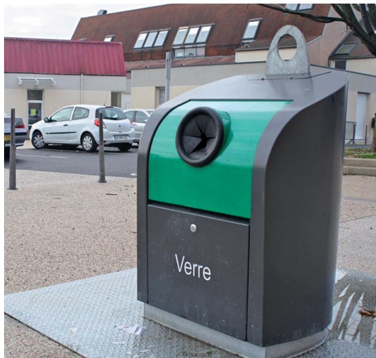
Les bennes enterrées permettent de collecter une plus grande quantité de verre.

Les déchets d'activités de soins à risques infectieux (DASRI) font également l'objet d'une collecte spécifique en raison des risques qu'ils peuvent générer. Actuellement, ils peuvent être déposés au poste de police municipale,