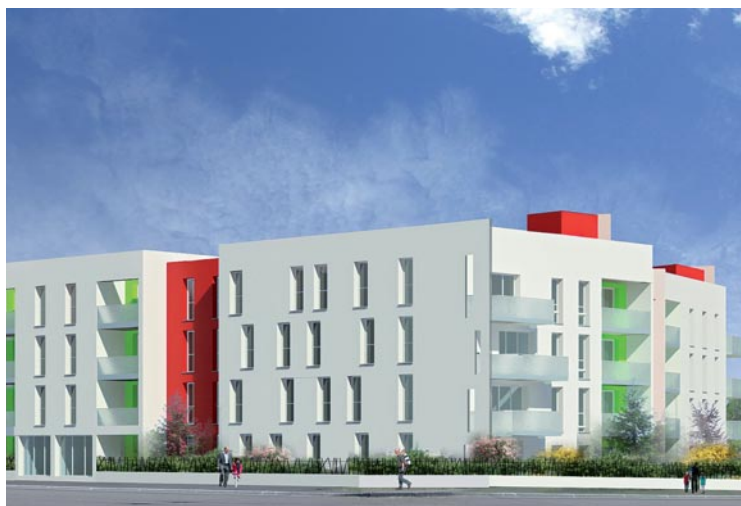
Le promoteur ARL construit un immeuble d'habitation mixte sur un terrain vendu par la ville - project Architecte Neptune

afin de ne pas nuire à la qualité de vie dans le quartier. Le projet du bailleur social Grand Lyon Habitat prévoit ainsi la construction de 15 logements, avec un local commercial pour une superette en rez-de-chaussé.