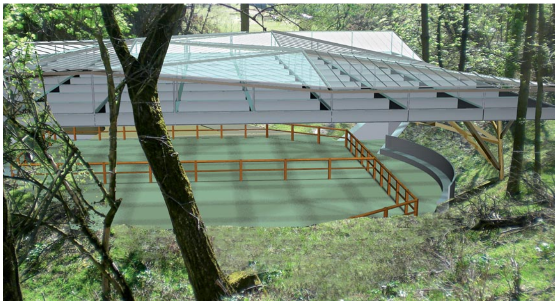
La réalisation d'un centre équestre destiné à un public varié (familles, scolaires, personnes handicapées...) est l'un des grands projets de 2012.

également et permettra à terme d'offrir des conditions de vie décentes aux familles désormais sédentarisées et installées à Feyzin depuis plusieurs années.