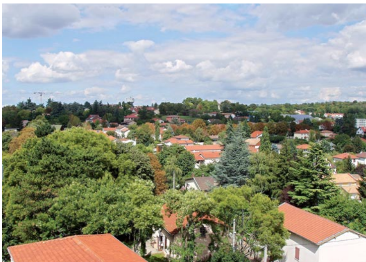
En 2012, les impôts communaux des Feyzinois vont baisser.

tissements de la part de la municipalité. Outre les dépenses "courantes" (entretien des bâtiments, achat de véhicules...), certains chantiers vont prendre fin, comme c'est le cas pour la rénovation du clocher de l'église et la réhabilitation du centre social, prévues pour s'achever au premier semestre 2012. La construction de l'aire d'accueil des gens du voyage rue Léon Blum se poursuit