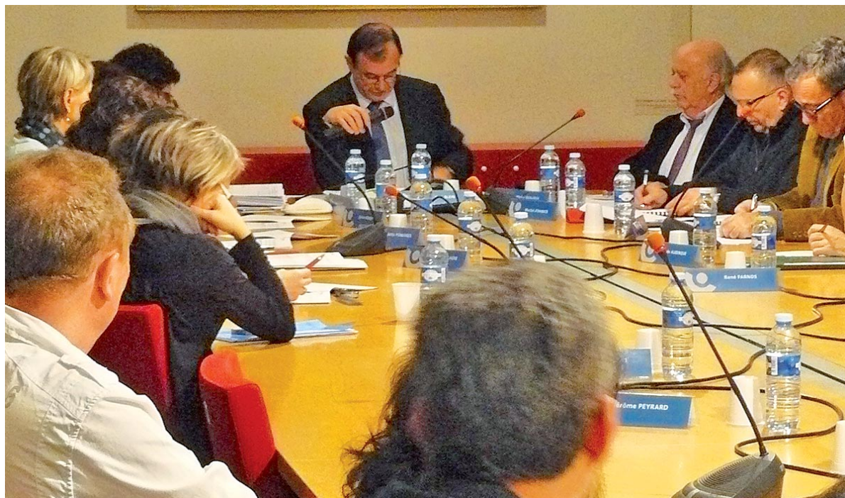
Le budget 2012 de la commune a été adopté le 26 janvier.

Comme le précise l'article L.2121-20 du code général des collectivités territoriales, les délibérations des conseillers municipaux se prennent à la majorité absolue des suffrages exprimés, ce qui exclut les bulletins blancs et les absentions. Les élus de l'opposition s'étant abstenus de voter pour ou contre l'adoption du budget 2012, ce dernier a été adopté à l'unanimité par le conseil municipal de Feyzin.