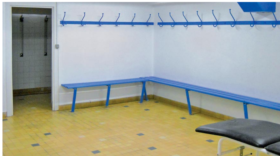
Les sportifs feyzinois bénéficient de vestiaires rénovés.

Depuis quelques semaines, les licenciés des clubs qui fréquentent le stade Jean Bouin profitent de vestiaires fraîchement repeints et de douches rénovées.