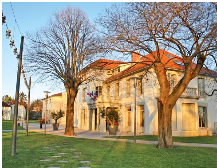
Les services administratifs sont réorganisés pour permettre la réalisation du projet "Place de l'église".

Après 3 jours de fermeture, la Maison de l'emploi pourra à