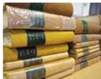
92 ans d'actes d'état civil numérisés en un mois.

traités de manière à ce qu'un fichier corresponde à un acte complet et lisible. Enfin ils sont indexés pour pouvoir les retrouver par nom, année ou numéro d'acte. Ces étapes de la numérisation des actes prennent environ un mois, pour des décennies de conservation des actes d'état civil dans les meilleures conditions. □