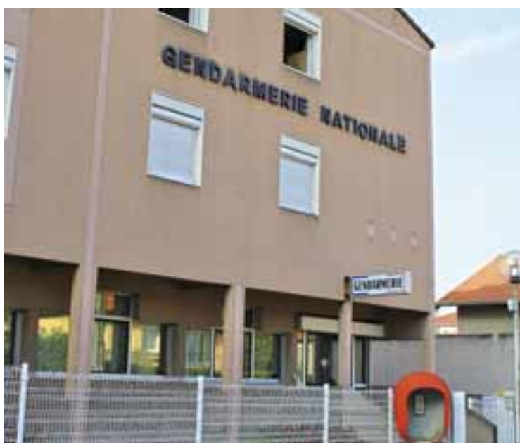
Le bâtiment de la gendarmerie, propriété de la commune, pourra être utilisé différemment dès la rentrée 2011.