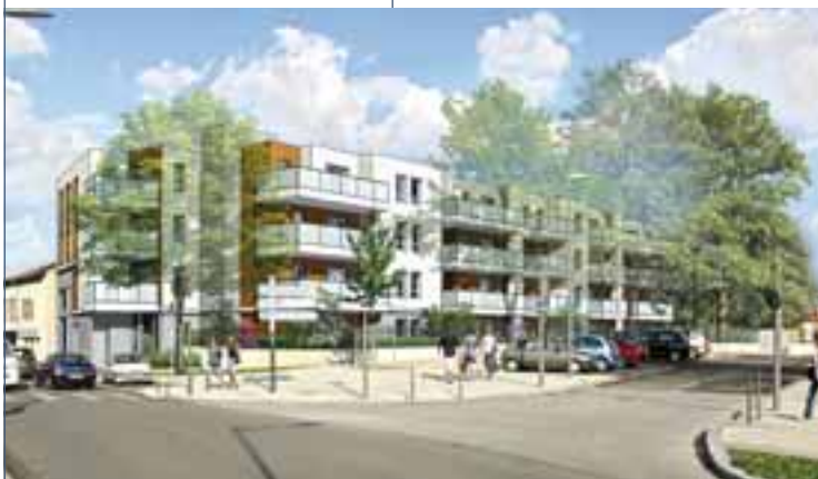
Les travaux de construction des Rives du parc démarrent début juillet.

La mairie de Feyzin, via le pôle solidarité, enregistre près de la moitié des demandes de logement, le reste étant déposé auprès des bailleurs sociaux ou des services de la préfecture. D'ici à quelques mois, le circuit de la demande de logement doit être simplifié et donner lieu à un guichet unique : un dossier déposé en l'un ou l'autre de ces lieux sera instantanément transmis à l'ensemble des bailleurs sociaux. Ce dispositif devrait simplifier et alléger les délais de traitement des demandes pour les satisfaire au mieux. □