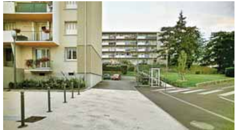
La demande d'un logement à Feyzin a été formulée par 399 familles en 2008.

Les analyses de l'ILHA permettent aussi d'analyser la demande de logement social. En 2008,