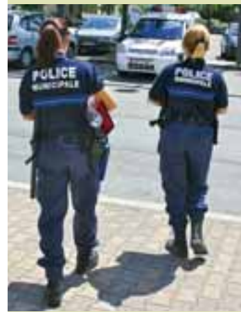
Dès 2011, les 11 policiers municipaux travailleront en coopération avec la police nationale.

L'annonce du passage en zone de police nationale intervient alors qu'un important chantier de réflexion est en cours au sein de la police municipale. Près de 10 ans après sa création, où en est ce service connu de tous ? Son organisation correspond-t-elle toujours à ses missions ? Ses horaires d'intervention sont-ils adaptés aux attentes des habitants ? Ses moyens sont-ils bien déployés ? Autant de questions qui ont été abordées durant un trimestre par tous les policiers municipaux accompagnés par un consultant spécialisé dans l'organisation du travail. Les propositions faites suite à cette analyse devront donc prendre en compte le nouveau partenaire que sera désormais la police nationale.