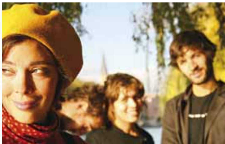
Le groupe Ginkgoa.

nationaux : "Déjeunez en herbe" du festival "Sur la route de Tullins", "Coup de Pouce" du festival "Barbara", tremplin chanson française de Saint-Chamond... Devant le succès de la scène, ils enregistrent un premier album autoproduit intitulé "Qu'est ce que je peux faire". Sortie en mai 2009, ce premier disque est déjà épuisé.[]