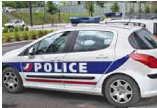
Une patrouille de trois policiers affectée 7j/7 et 24h/24 à Feyzin dès 2011.

Il convient désormais de traduire cette annonce en une convention qui liera l'Etat et la commune. Un long travail juridique et administratif qui va commencer dans les prochains jours. Mais il faudra