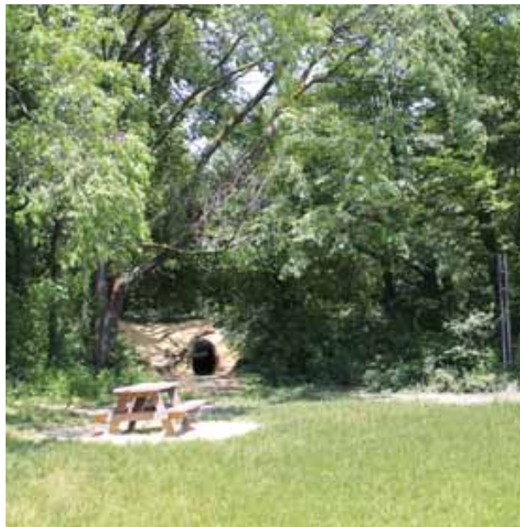
Cinq foyers aménagés pour des barbecues en toute sécurité au parc des trois cerisiers.

Mais qui dit barbecue, dit également nécessité de règles de sécurité. Ainsi, il est interdit de faire des feux en dehors des zones matérialisées, qui ont été placées conformément aux usages constatés auparavant. Il faut également savoir qu'un barbecue se fait sous la seule responsabilité de son utilisateur,