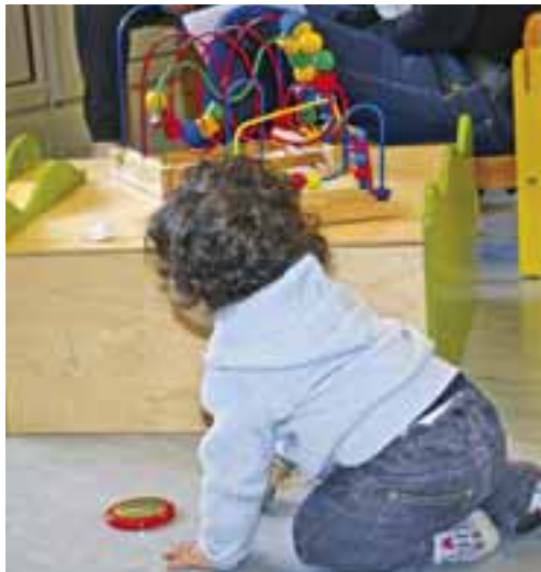
L'espace petite enfance et le RAM accueillent 206 enfants, soit 60% des 0-6 ans de Feyzin.

12 juin prochains. Le 11 juin à partir de 17h, l'espace petite enfance de La Tour démarre les festivités. Un moment "portes ouvertes" permettra de découvrir et visiter les lieux pour apprécier la diversité de l'accueil de la petite enfance. Les tout-petits pourront assister à des ateliers lecture, et s'exercer à des jeux de manipulation et de motricité avec une intervenante spécialisée. L'inauguration officielle sera prononcée par M. le Maire et par le représentant de la CAF. Puis un spectacle préparé par les assistantes maternelles du RAM et par celles de la crèche familiale, proposera des chansons