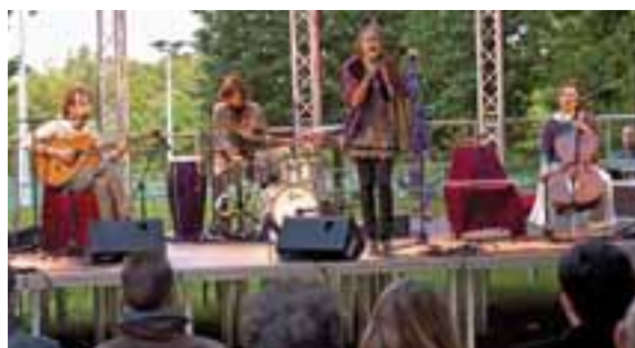
Le concert de Gingkoa offert aux feyzinois pour la fête de la musique 2010 était programmé par l'Épicerie moderne.