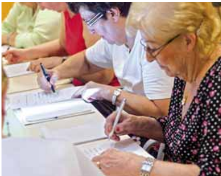
Des ateliers remue-méninges pour prévenir la perte de mémoire.

Jeux et exercices de stimulation ont été proposés lors des cinq séances de remue-méninges à la médiathèque, auxquelles ont participé gratuitement onze