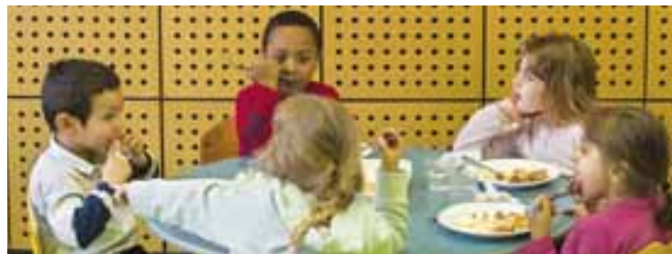
C'est la rentrée aussi pour la cantine, avec ses copains et ses copines.

En dehors des jours d'école, l'accueil de loisirs au centre des