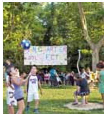
Le 8 juillet "mon quartier en fête" a investi le secteur Bandonnier-Géraniums.

Elle aura finalement lieu samedi 18 septembre avec des animations familiales et un repas de quartier. Tous les Feyzinois sont évidemment les bienvenus pour le cinéma en plein air dès la tombée de la nuit installé rue des Maures : retour vers l'âge glaciaire avec L'Âge de glace 3 , séance organisée avec le centre social Mosaïque. □