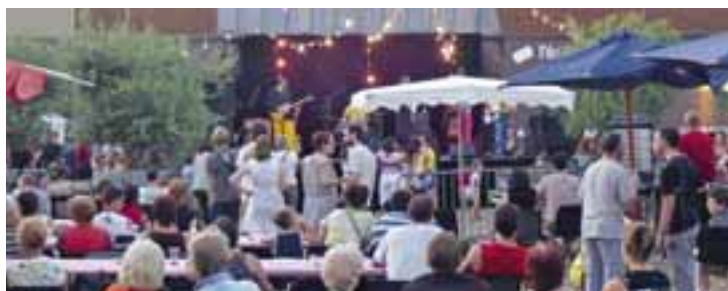
Depuis 2007, l'Épicerie moderne et le centre social Mosaïque s'associent pour organiser la guinguette de l'Épicerie, soirée familiale pour fêter l'été.

Et qui dit anniversaire dit surprise. Alors, cerise sur le gâteau : Elvis sera aussi de la partie lors de cette soirée de fête et de brassages musicaux. Pas de cadeau seul ou groupé à prévoir : l'anniversaire de l'Épicerie moderne est gratuit et ouvert à tous, le vendredi 1 er octobre dès 20h30.