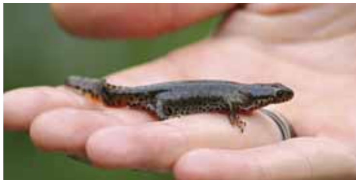
Le triton alpestre (ici une femelle), espèce d'amphibien protégée, a élu domicile dans la mare des trois cerisiers.

mare a été effectué en début d'été par le centre ornithologique de Rhône-Alpes (CORA). Et les résultats sont très positifs. Crapauds calamites, grenouilles vertes, salamandres tachetées, tritons alpestres ou palmés : ce sont cinq espèces protégées d'amphibiens - dont les promeneurs du parc connaissent bien les chants - qui ont élu domicile dans la mare des trois cerisiers.