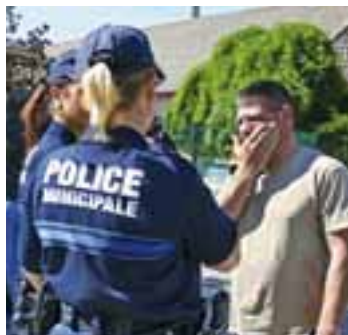
Encore plus de présence auprès des habitants pour la police municipale.

Les agents peuvent être contactés les jours de semaine de 14h à minuit au 04 78 70 00 00. Durant le week-end, la police municipale est joignable : d'avril à octobre le samedi de 14h à minuit et le dimanche de 8h à 20h, et durant