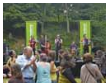
Chaque année, l'Épicerie moderne participe au fort en bal(l)ade, comme en 2009 avec le Tram des balkans.