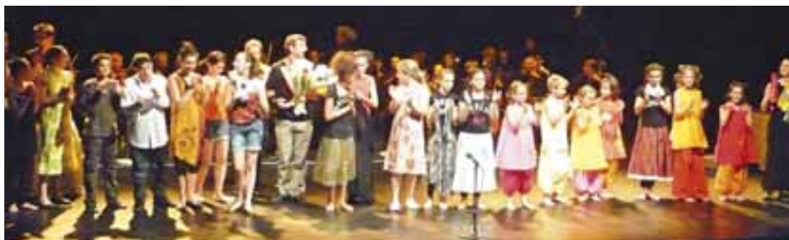
L'Épicerie moderne accueille des spectacles locaux, comme ici le Voyage ! proposé en mai 2010 par l'école de musique et la compagnie de théâtre les art'souilles.