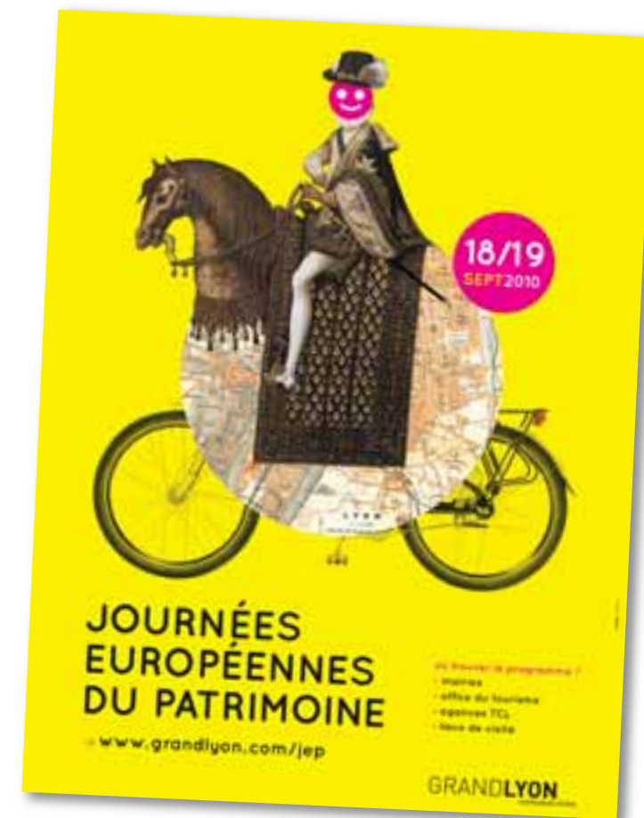
Rendez-vous les 18 et 19 septembre au fort de Feyzin pour un patrimoine en musique !

Dimanche 19 de 14 à 18h, la balade dans le fort est également