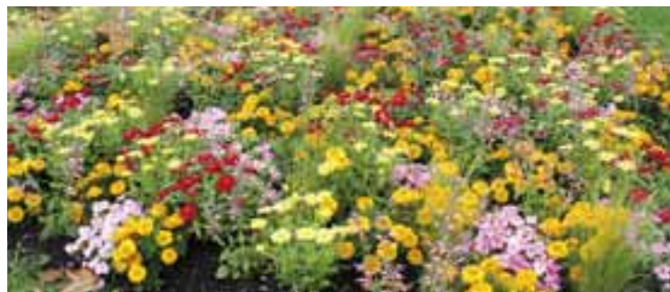
Un tapis fleuri parc de l'Europe parmi les 30 000 spécimens du fleurissement d'été.

Au menu tout d'abord : les tapis fleuris. Pas besoin d'être spécialiste en horticulture pour les planter, puisqu'ils se présentent sous forme de parterres prêts à planter. Avec un fleurissement et une mise en place plus rapide que pour des plantations traditionnelles - pour un même coût global – les tapis fleuris représentent 60% des plantations saisonnières à Feyzin. Depuis ce printemps ils sont biodégradables, ils seront donc acheminés à la plateforme de déchets verts lorsqu'ils devront faire place à leurs confrères d'automne. Les variétés changent chaque année, elles sont réparties selon six