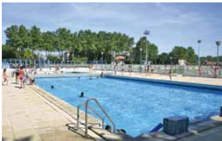
Plonger, nager, patauger, sauter... Plouf, splash - mais pas aïe ! Deux mois pour explorer toutes les possibilités des bassins de la piscine du stade Jean Bouin.

Tous les renseignements sont disponibles à la mission jeunesse : 04 72 21 46 73.