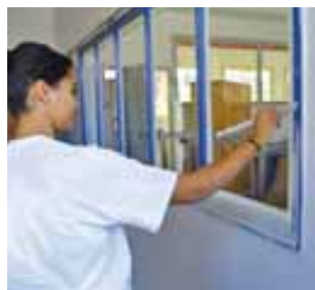
Une première expérience professionnelle pour 32 jeunes feyzinois de 16 et 17 ans.

peintures à l'école de musique ou à l'école maternelle George Brassens, rafraîchissement de parties communes dans des résidences gérées par des bailleurs sociaux, ou même le dépoussiérage des archives de la ville ! Autant de travaux qui permettent aussi à la Ville de mieux connaître les jeunes de la commune, et éventuellement de les aider ou les conseiller dans leur orientation et leurs projets. □