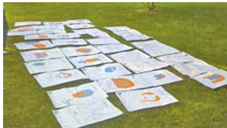
Une trentaine d'affiches créées par des jeunes feyzinois pour Les Subsistances.

aginez maintenant » : cet événement national en faveur de la jeune création, piloté par Les Subsistances pour la région lyonnaise, s'est déroulé du 1 er au 4 juillet. □