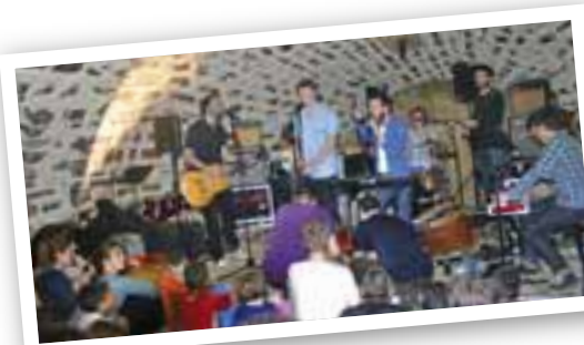
... ou assister à des concerts comme celui de Syd Matters (avec l'épicerie moderne) au caveau jazz.