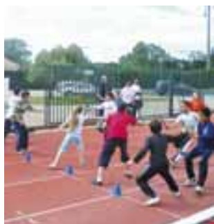
Cinq écoles en compétition amicale lors des Interscholaires d'athlétisme.