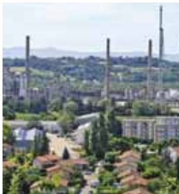
Dès l'adoption des PPRT, les habitants bénéficieraient, grâce à la mobilisation de l'association Amaris, d'un crédit d'impôt de 40 % sur des travaux rendus obligatoires de sécurisation.

Avec l'instauration des plans de prévention des risques technologiques (PPRT), certains habitants seront bientôt dans l'obligation de réaliser des travaux de consolidation, par exemple renforcer les ancrages de fenêtres pour pouvoir mieux résister en cas d'explosion. En mai dernier, à l'occasion de l'examen de la loi dite du Grenelle 2, les députés avaient prévu un dispositif permettant un crédit d'impôt de 40 % du montant de ces travaux supportés par les habitants des zones de risques technologiques.