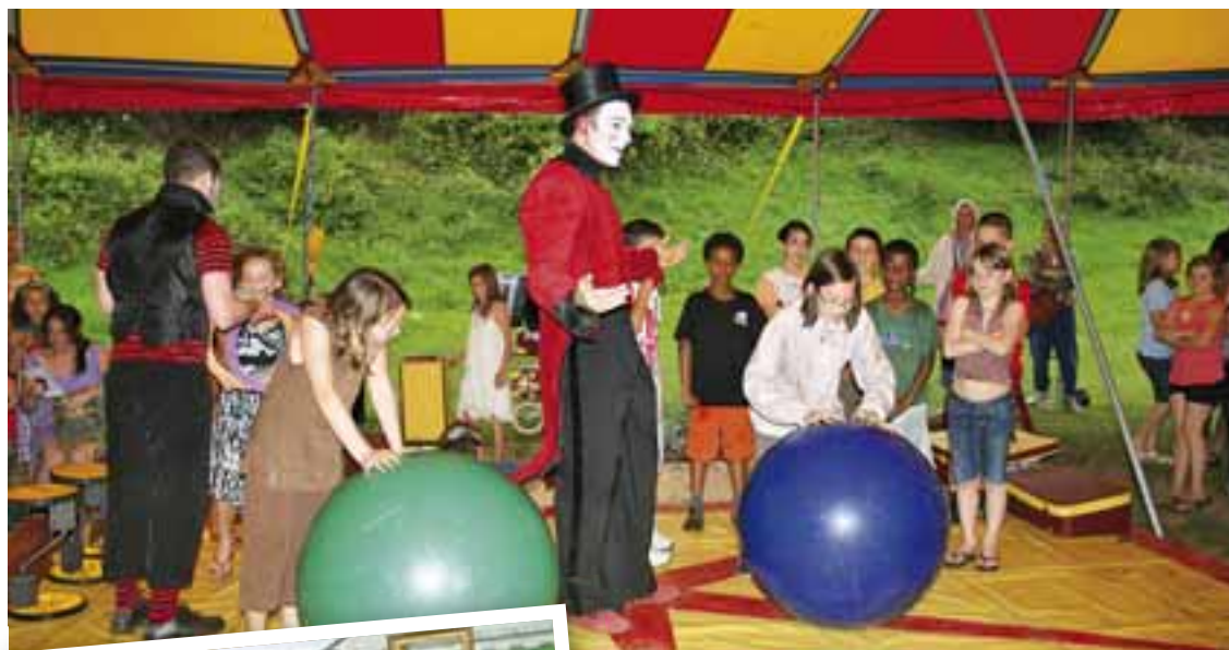
Petits et grands ont pu s'exercer à diverses activités de cirque avec la compagnie Cirque autour...