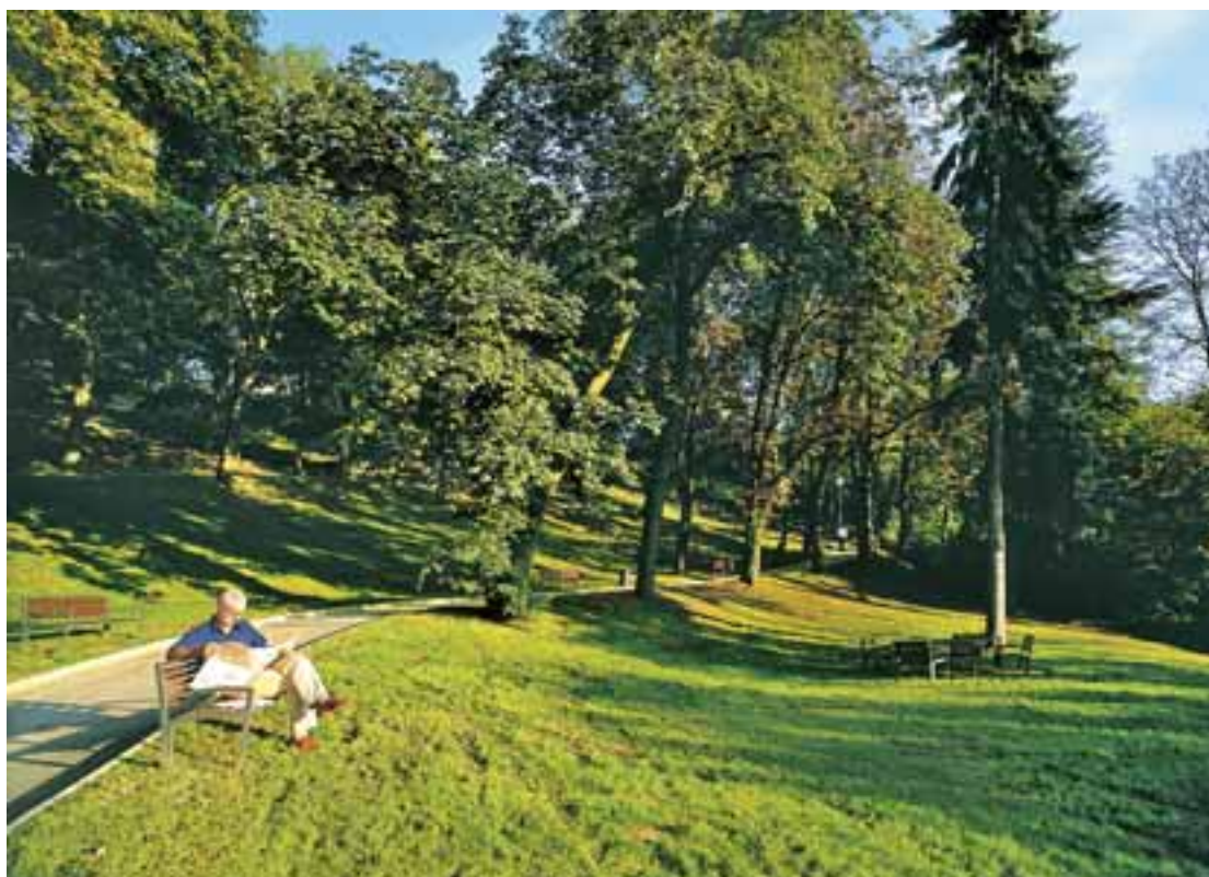
Bancs, tables de pique-nique, barbecues (sur les espaces dédiés au parc des trois cerisiers) : c'est le moment de profiter de l'été dans l'un des parcs de Feyzin.

Particulièrement attendu après un printemps maussade, l'été est enfin là. Une saison propice à prendre l'air, prendre son temps, prendre un verre, prendre le soleil (en évitant ses coups). Parcs, piscine, centres de loisirs, animations de quartiers : pour les petits et les grands, des idées et activités à Feyzin pour occuper douces soirées ou beaux week-ends, et longues vacances pour les plus jeunes.