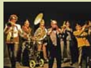
La fanfare funk Imperial Kikiristan fait escale à Feyzin le 8 juillet.