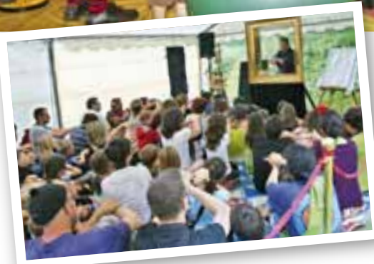
... ou prendre une leçon de manipulation de marionnettes avec le Montreur...