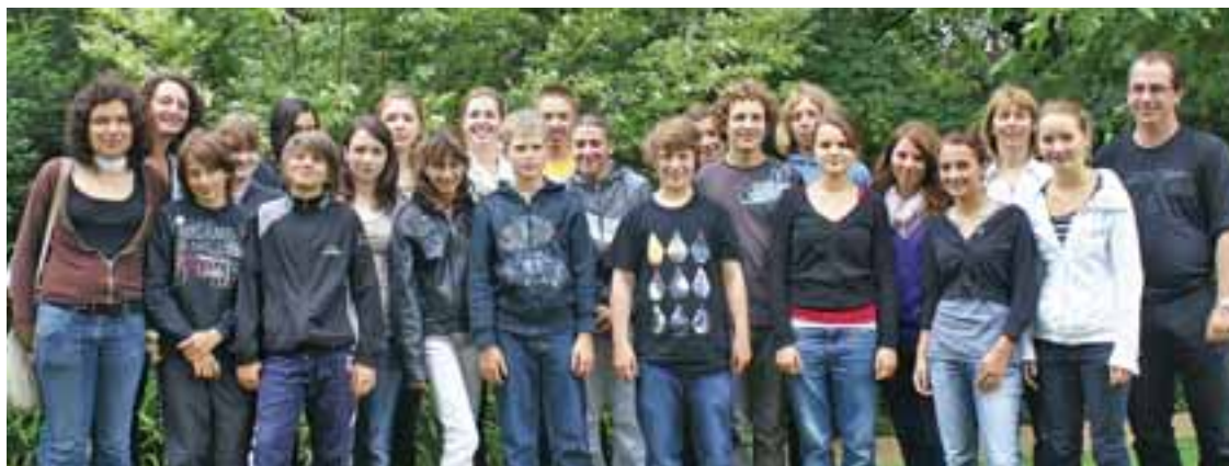
Une visite de fin d'année pour une classe de collégiens de Laupheim.

Du 13 au 20 juin, Feyzin a accueilli une classe venue de Laupheim, dans le cadre des échanges régulièrement organisés entre collégiens allemands et français.