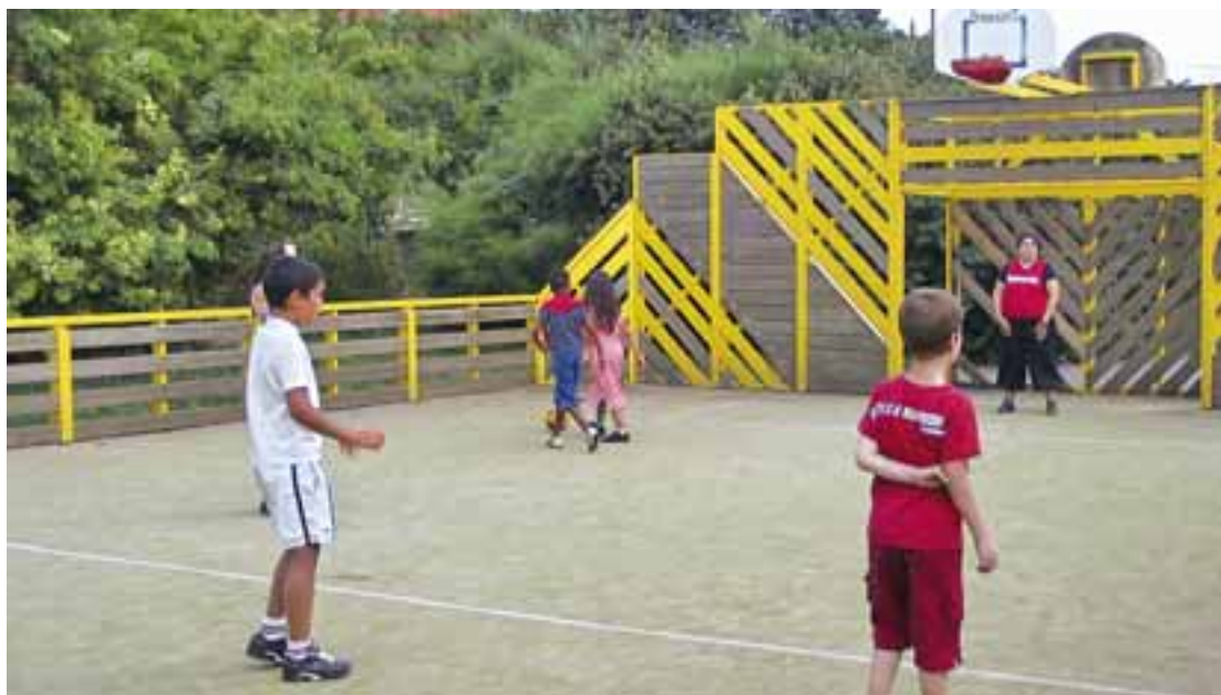
Activités encadrées ou autonomes, sport ou farniente, centre de loisirs ou animations de proximité : c'est les vacances pour les 2-17 ans.

aux enfants de 6 à 16 ans : des révisions de connaissances et de méthodes de travail pour mieux se préparer au passage en classe supérieure. Des séances sont également proposées aux parents, pour bien aider ses enfants dans leur scolarité. Et parce que ce sera quand même encore un peu les vacances, pas de notes ou devoirs pendant cette semaine là, mais une ambiance détendue et des moments d'échanges avec les enfants et leurs parents. □