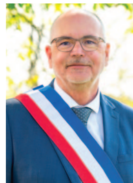
Marc MAMET Maire de Feyzin

Un week-end à l'image de notre commune, unie dans la diversité de ses paysages et de ses quartiers. Le programme complet des festivités de l'été sera annoncé dans les prochaines semaines : je peux déjà vous révéler que nous vivrons de grands moments partagés tout l'été. J'ai hâte de partager ces moments inoubliables avec vous.