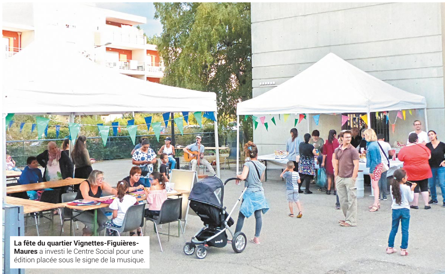
La fête du quartier Vignettes-Figuières-Maures a investi le Centre Social pour une édition placée sous le signe de la musique.

COLLABORATION FÊTE EMBELLISSEMENT SENSIBILISER PARTICIPER NOËL ENGAGEMENT ACCUEIL PERSÉVÉRANCE SÉCURITÉ CONVIVIALITÉ MUSIQUE